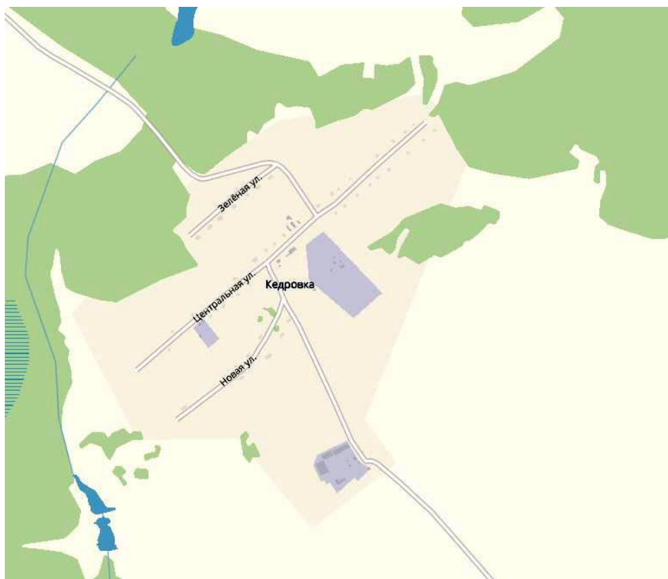
Рисунок 1.3 Дорожная сеть д. Кедровка