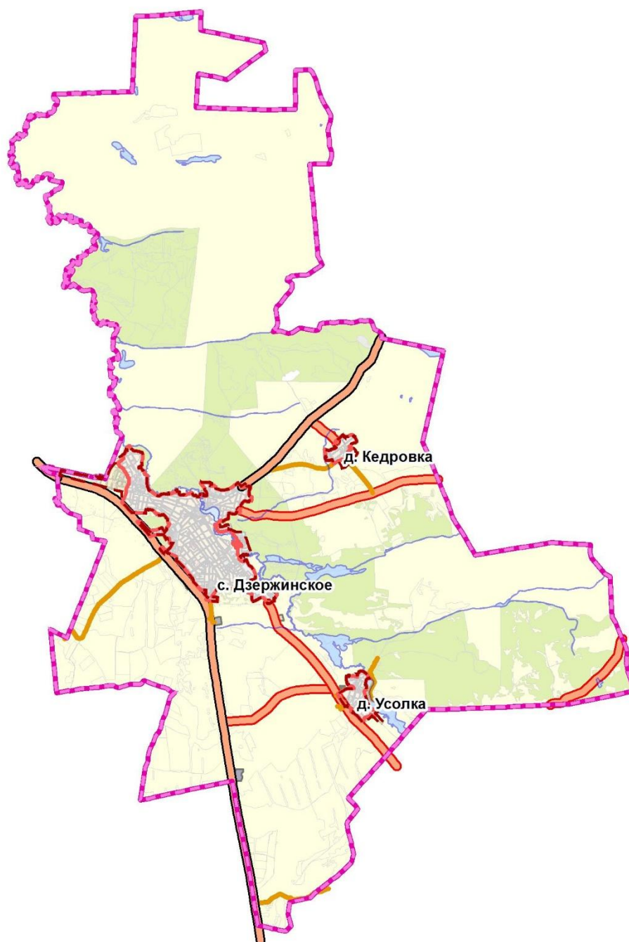
Рисунок 1.1 Границы территории Дзержинского сельсовета